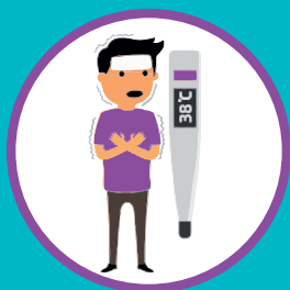
ПОВЫШЕННАЯ ТЕМПЕРАТУРА ТЕЛА