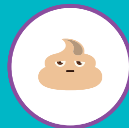
ИЗМЕНЕНИЕ ЦВЕТА КАЛА