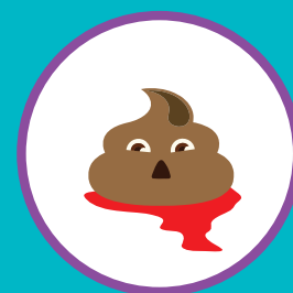
ПРИМЕСИ В КАЛЕ (СЛИЗЬ, КРОВЬ)