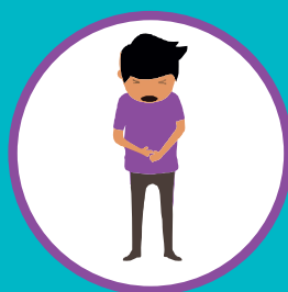
БОЛЬ В ЖИВОТЕ